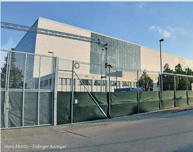
Hans Moritz – Erdinger Anzeiger

München. Weigern sich abgelehnte Asylbewerber, Deutschland innerhalb einer bestimmten Frist freiwillig zu verlassen, werden sie abgeschoben. Um eine Abschiebung von in Haft genommenen abgelehnten Asylbewerbern sicherzustellen und zügig durchführen zu können, hat der Freistaat Bayern „in Umsetzung des von der Bayerischen Staatsregierung am 5. Juni 2018 beschlossenen Bayerischen Asylplans zur kurzfristigen Schaffung weiterer Abschiebungshaftplätze die sogenannte Wartungshalle Ost im Hangar 3 von der Flughafen München GmbH“ ab 16. August 2018 „vorübergehend angemietet. Diese Örtlichkeit bietet eine sehr gute infrastrukturelle Anbindung, insbesondere hinsichtlich der Verkehrswege.